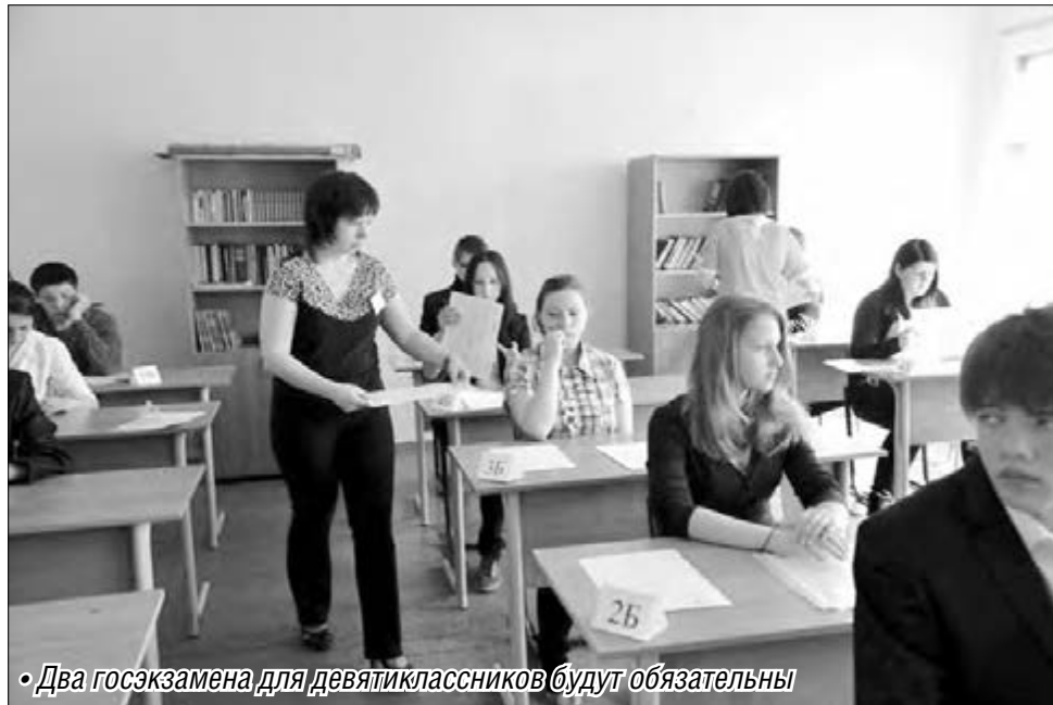
• Два госэкзамена для девятиклассников будут обязательны

Для учеников, поступающих в профильные старшие классы, региональные