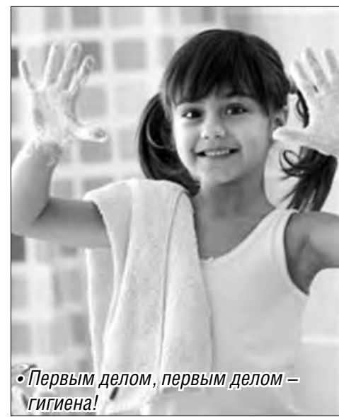
• Первым делом, первым делом – гигиена!