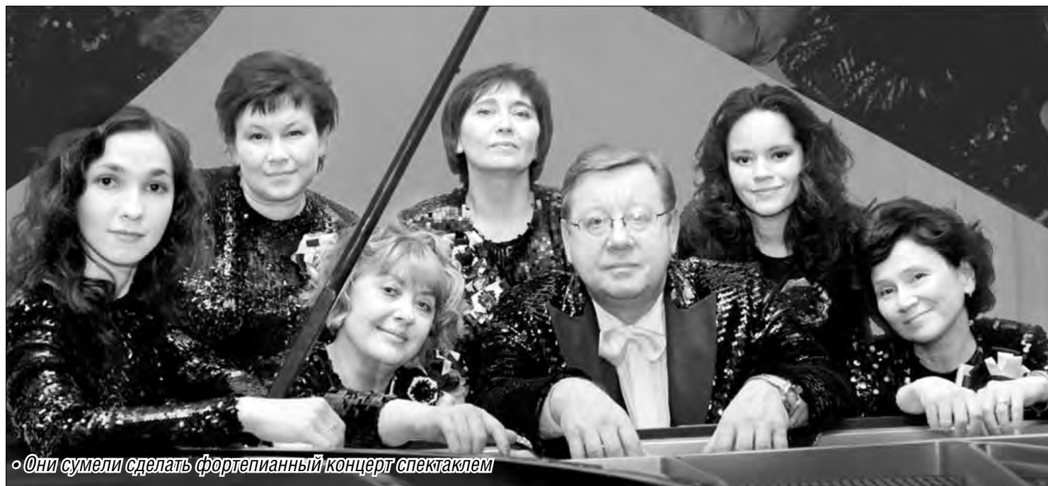
«Они сумели сделать фортепианный концерт спектаклем»

Шесть пианисток, один профессор и семь нот творят чудеса