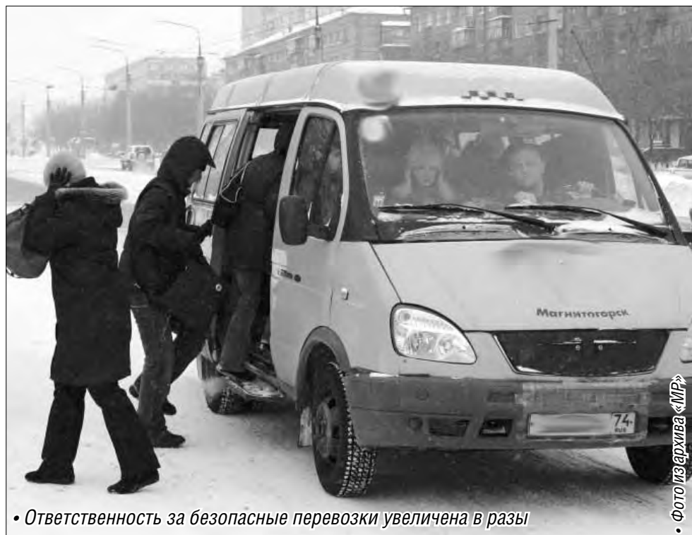
• Ответственность за безопасные перевозки увеличена в разы

А ведь ответственность за выпуск на линию неисправных транспортных средств и допуск к управлению нетрезвых водителей установлена не только для должностных лиц, но и для собственников автопредприятий – юридических лиц и индивидуальных предпринимателей. Если учитывать, что в обеих столицах ежедневный доход от перевозок данным видом транспорта приносит около 375 миллионов рублей его владельцам, то