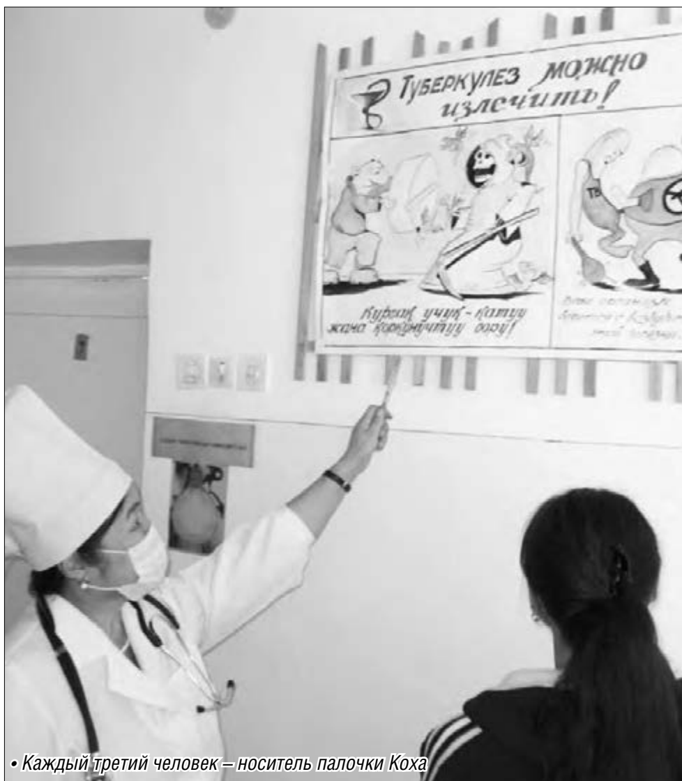
• Каждый третий человек – носитель палочки Коха

глубокой древности. Она получила название «чухотка», так как заболевшие увядали, чухали буквально на глазах. Это заболевание является хронической инфекцией определенным типом бактерии Mycobacterium tuberculosis , которая обычно поражает легкие. Туберкулез по сей день считается одной из главных причин высокой смертности во всем мире. Большинство летальных исходов происходит в развивающихся странах, где профилактика опасного заболевания до сих пор на очень низком уровне. В 2006 году был разработан Глобальный план борьбы с туберкулезом, целью которого является сокращение смертности от легочного заболе-